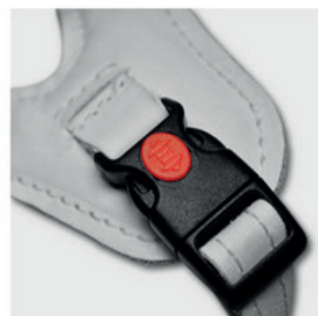
fixlock avec Verouillage (option)