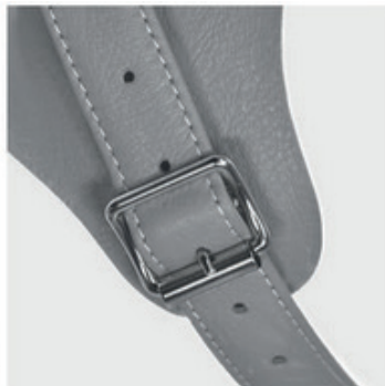
Boucle renforcée (option)